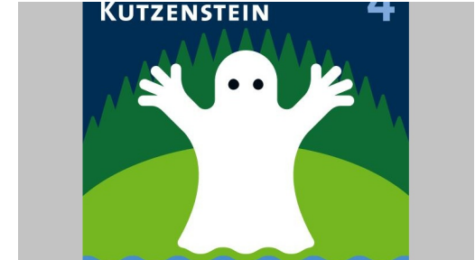
Piktogramm Kutzenstein